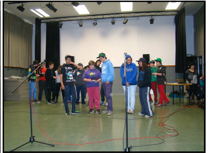
Mendialdeko bertso festa, maiatzaren 23an, Kanpezun

Ikasturte honetan, urritik maiatzera, 2200 ikaslek landu dute bertsolaritza eskola ordutan. Gelan egindako lanak jendaurrera ateratzeko aukera izan dute ikasturte amaieran. Ikasturtean zehar egindako lanaren ardatzetako bat izan dira jendaurreko emanaldiak, ikastetxe guztietan egin dituzte eskola mailan edo beste ikastetxeren batekin. Hala ere, maiatzaren amaieran eta ekainaren hasieran egin diren herri edo eskualde mailako ikastetxeen arteko topaketek amaierako ginda paregabea eman diote ikasturte osoan zehar egindako lan paregabeari.