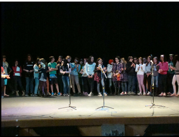
Aguraingo Harresi aretoa, maiatzaren 29an

Erreleboa Aiaraldeak hartu zuen Amurrioko Antzokian maiatzaren 29an egin zen Amurrioko ikastetxeen topaketarekin. Egun berean Lautadako ikastetxeen topaketa izan zen Aguraingo Harresi aretoan. Maiatzaren 31an Laudioko ikastetxeen txanda izan zen eta azken topaketa, Añana eskualdeko ikastetxeen artekoa izan zen, Ekainaren 4ean Langraitzeko kultur etxean. Ipuinak bertsotan, asmakizunak, antzerkiak, bertso-hop emanaldiak, umorezko koplak... denetarik izan dugu bertan, baita bat-bateko saioak ere. Hurrengo urtean gehiago eta hobeto.