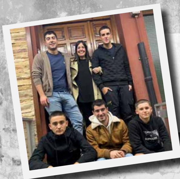
ARAMAIXOKO TALUEK (ARAMAIO, GORBEIALDEA)